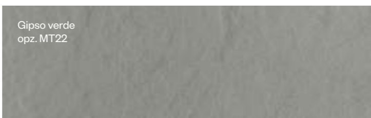
Gipso verde opz. MT22

Пастозная фактура, представленная в палитре нежных оттенков, интерпретирует податливую консистенцию гипса и его природу как мягкого материала известкового происхождения. Поверхность с динамичной текстурой и монохромными акцентами кажется нежной и шелковистой на ощупь.