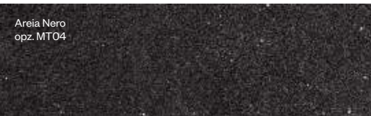
Areia Nero opz. MT04