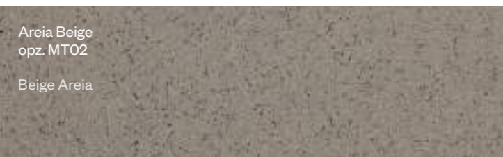
Areia Beige opz. MT02