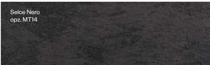
Selce Nero opz. MT14