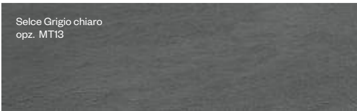
Selce Grigio chiaro opz. MT13

Отделка с более однородной и плотной текстурой — оригинальная интерпретация техники бучардирования, традиционно применявшейся в работе с песчаником. Цветовая гамма с холодными и теплыми оттенками представляет хроматическое чередование однородной градации фона с зернистыми вкраплениями минералов контрастного тона.